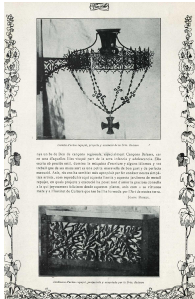
Fig. 8. Obras en forja de Amparo Buissen y Casablanca en: Romeu, J. (1913), "L'art y la dòna", Feminal , 31-I-1913, pp. 9-10, espec. 10.