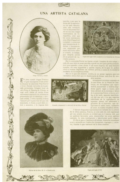
Fig. 7. Retrato y obras de Pilar Ferrer en: Anon. (1910) "Una artista catalana", Feminal , 25-X-1910.