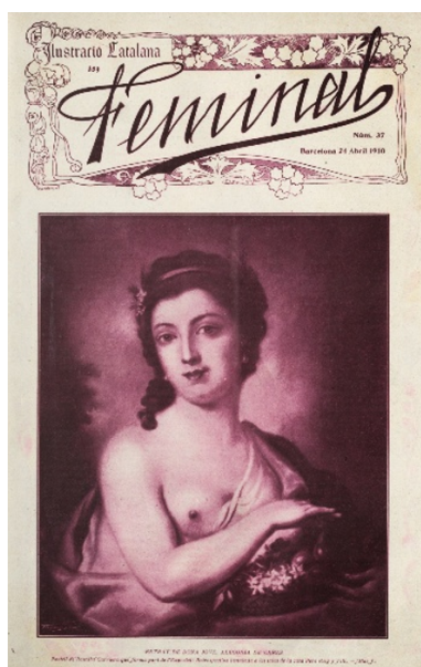
Fig. 5. Portada del nº37 de Feminal con la obra Alegoría de Ceres de Rosalba Carriera, Feminal , 24-IV-1910.