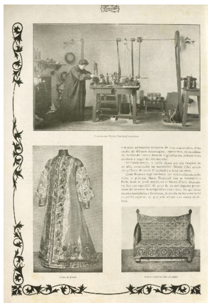
Fig. 6 María Maria Klavdievna Tenisheva en su taller y sus obras en: Anon. (1910) "L'obra de la princesa María Tenicheff", Feminal , 24-IV-1910, p. 4.

esmaltado y punta seca (Fig. 7) de Pilar Ferrer y Jover (s.f.) (1910: 16); así como las composiciones en forja (Fig. 8) de Amparo Buissen y Casablanca (s.f.) (Romeu, 1915: 9-10) y las fotografías (Fig. 9) de María Codina (1896-1978) (1916: 4). [7]