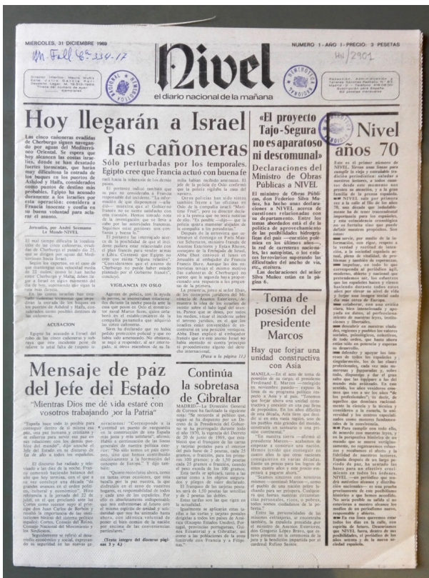
Fig. 4 Nivel el diario nacional de la mañana, núm. 1, 31 de diciembre de 1969, portada, Biblioteca Nacional de España, Madrid.