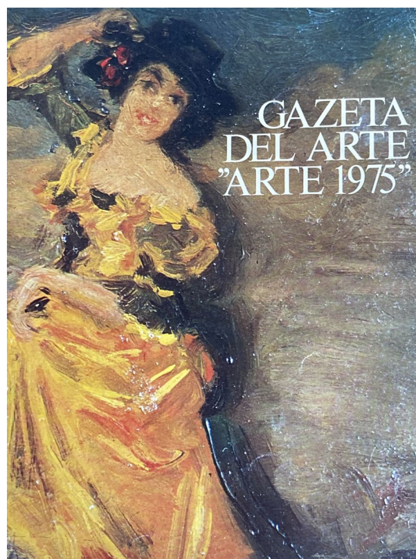
Fig. 8 Gazeta del arte "Arte 1975", Anuario, colección particular.

En cuanto al futuro, lo veían con optimismo: