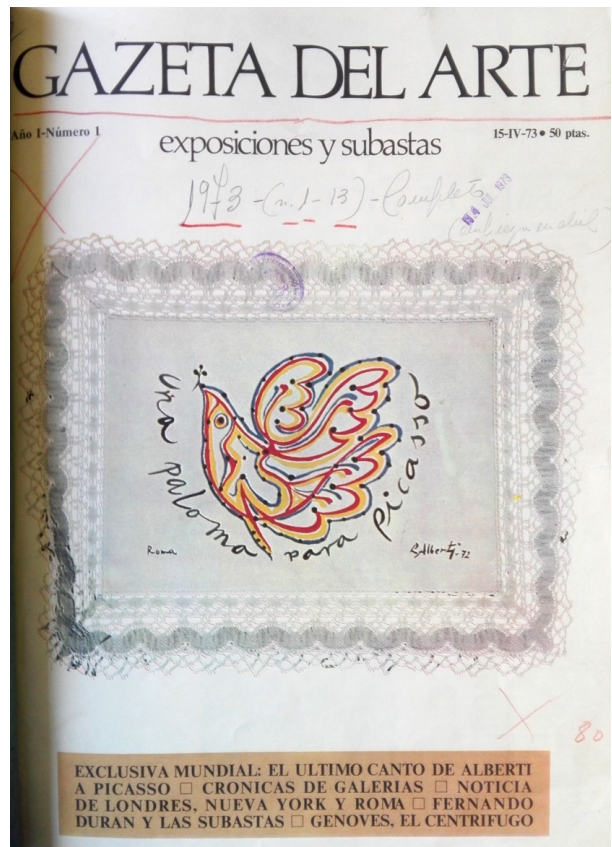
Fig. 5 Gazeta del arte, núm. 1, 15 de abril de 1973, portada, Biblioteca Nacional de España, Madrid.

El 15 de abril de 1973 salía a la venta el primer numero de Gazeta del arte (fig. 5), publicación quincenal “sobre el arte y sus fenómenos económicos y sociales” que constaba de “32 páginas en gran formato y a color para los interesados espectadores de un mundo agitado en el que es importante tener ideas claras y puntual de información”. Para los editores con Gazeta del arte se había “comenzado a escribir la nueva historia del arte”. [31] Según informaba ABC, la revista venía “a llenar no ya el hueco de su periodicidad más próxima –la quincena–, sino del contenido” al tratar la actualidad con “especial atención por las exposiciones y subastas”. [32]